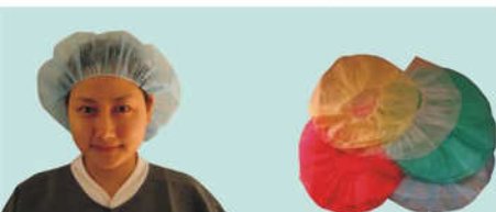
EGM7398 Bouffant Cap