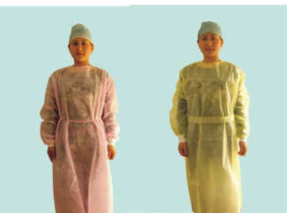
EGA5388 Isolation Gown EGA5389