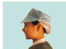
EGM7397 Snood Cap