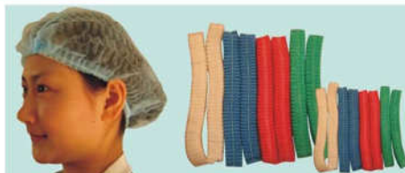
EGM7399 Mob Cap